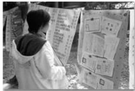
시후의 칭하이 데이 경축 포스터에는 스승님이 세계 각지에서 벌이신 최근 인도주의적 활동들이 보고되어 있다