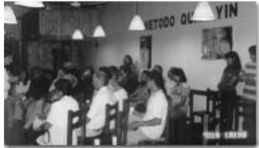
부에노스아이레스 동수들이 아르헨티나 중부와 남동부에서 스승님의 가르침에 관한 비디오 세미나를 개최하다

다음날에는 “업장을 소멸하는 법”이라는 주제로 두번째 세미나가 열렸다. 역시 편안한 분위기 속에서 많은 사람들이 방편법을 배우겠다고 신청했다. 명상이 끝난 뒤 단체명상의 중요성에 대해 이야기하자, 새 입문자 한 사람은 즉시 자기 집에서 주간 명상을 갖자고 제안했다. 셋째날, 살아 있는 깨달은 스승과의 만남에 대한 필요성에 초점이 맞춰진 토론에서 많은 참석자들은 이에 동의하며 고개를 끄덕였다. 이를 전에 방편법을 배운 한 사저는 영적 수행으로 벌써 더 건강해지고, 숙면을 취하게 되었다고 말했다. 세미나가 열렸던 식당의 주인은 영적인 양식을 체험하게 된 데 대해 깊은 감사를 표했다. 새로운 수행자들을 돕고 지원하기 위해 두 달 안에 또 다른 모임을 개최하기로 했