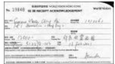
성금 1만 2천 달러 (홍콩달러) 기부에 대한 선명회(宣明會)의 영수증