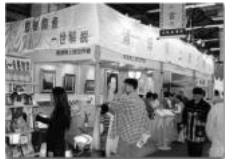
카오슝 국제 도서 박람회에 참가한 우리 단체 코너에서 영성을 빛낸다

카오핑 동수들은 스폰서의 초빙을 받아 도서 박람회의 개막식에서 화려한 민속춤 공연을 선보였는데, 청중들로부터 큰 박수와 앙코르를 받았다. 또한 박람회 기간 동안 관음사자의 주관으로 “칭하이 무상사와 관음법문”에 대한 세미나가 진행되었다. 세미나에서 스승님 소개 비디오와 2000년 5월 5일 타오웬 경기장에서 하신 스승님의 강연 테이프가 상영되었으며, 쏟아진 많은 질문에 흡족한 답변이 잇달았다. 이 성공적인 세미나는 2001 카오슝 국제 도서 박람회에 영성의 빛을 한층 빛내는 자리가 되었다.