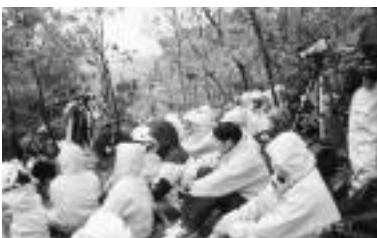
과정 중 인터뷰 방법과 사진술을 비롯한 뉴스 인터뷰 교육이 진행되었다

스승님의 무한한 사랑으로 칭하이 무상사 국제협회는 전세계에서 수많은 구조활동을 오랫동안 수행해왔다. 그러나 일부 재해지역 당국은 전문적인 자격증을 갖춘 사람들의 접근만 허용하여, 이 경우 동수들은 밖에서 제한된 구조활동만 할 수 있었다. 그래서 포모사 동수들은 자격증을 갖춘 후 유사시 보다 완벽하고 더 나은 도움을 주기 위해 다양한 구조활동 방법을 배우기 시작했다. 한편 지방자치 단체의 관련법 및 규제조항, 정식 자격증 요구 등을 충족시키는 공식적인 자원봉사대를 조직하는 것도 시급했다. 이에 포모사 동수들은 산악지형에서의 구조활동을 위한 등하반에 대한 기술, 라디오 교신, CPR(응급 호흡조치법), 다이빙 등을 포함한 구조대 교육과정을 계획했다. 초빙된 과정별 전문 교관들은 엄격하고 철저하게 각 과정을 지도했다. 참가자들은 각 과정을 마친 후 시험을 거쳐 관련 자격증을 얻게 되었다.