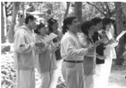
포모사 입문자들이 아름다운 노래를 통해 스승님에 대한 무한한 사랑과 갈망을 표현하다

“우리는 당신의 모범을 따르기 위해서 그리고 당신의 가르침을 행동으로 옮기기 위해서 최선을 다할 것입니다.”