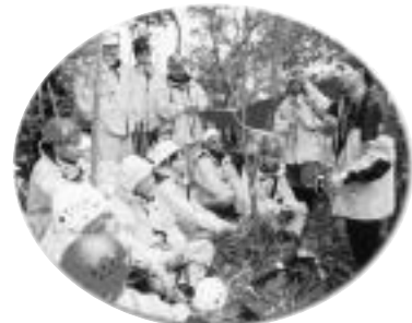
매듭 묶는 법과 사용법에 대한 설명