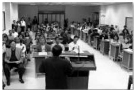
까오슝 국제 도서 박람회의 스폰서들을 초대한 가운데 스승님의 가르침을 소개하다