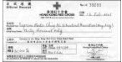
성금 3만 달러 (홍콩달러) 기부에 대한 홍콩 적십자사의 영수증

스승님은 자연재해는 사람들의 마음에 기인한다고 말씀하신 바 있다. 입문자들은 이 세상을 정화하는 데 있어 신실한 명상이 얼마나 중요한지 깨닫게 되었다.