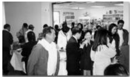
캘리포니아 오렌지카운티의 음악과 시 센터의 1주년 기념식에 참석한 손님들

훌륭한 활동들을 알게 되었고, 이번 음력설에 미국을 방문하는 중 시간을 내어 센터에 들르게 되었다. 그는 “음악으로 하나되는 평화의 세상”과 스승님의 “무자(無子)시”를 새해선물로 받고 매우 행복해했다.