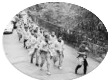
달리기는 신체능력을 기르는 한 교육과정