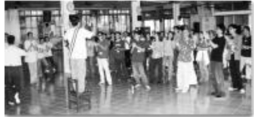
포모사 전역의 청소년 동수들이 타이충 센터의 팀워크 훈련 캠프에 참가하다

수업이 이루어지는 동안 모든 참가자는 수업에 열중했다. 동수들의 지도와 훈련으로 그들은 전에는 미