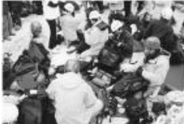
참가자들이 배낭을 싸는 법을 배우고 있다